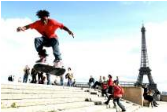
(926) Pratique sur espace non aménagé Skate au Trocadero, un loisir pour les pratiquants et une attraction pour les touristes.