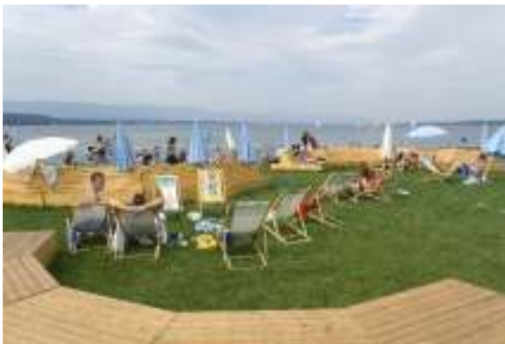
(1017) Présence humaine, animateur, gardien Chaque été, la Ville de Genève met gratuitement des chaises longues à la disposition du public. La gestion est assurée par des jeunes qui également renseignent la population, veillent à la propreté des lieux et de collaborent à diverses animations.