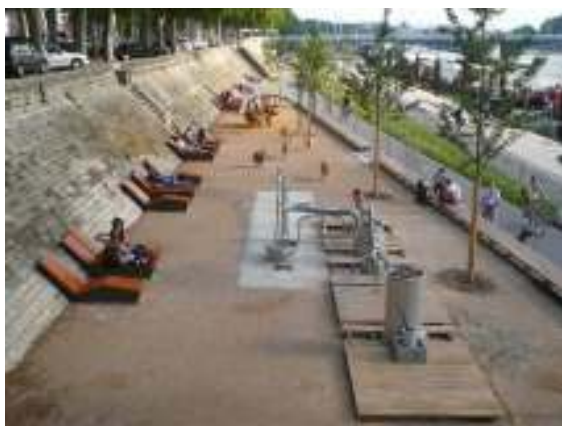
Sport et détente sur les berges du Rhône à Lyon

Cela conduit, outre les recommandations sur les modes de vie dans les sphères privées et professionnelles, à faire évoluer la conception architecturale et urbaine. Des espaces publics plus adaptés à la pratique de l'activité physique et sportive, aux jeux des enfants et ce dans un environnement moins pollué sont souhaitables. Par ailleurs, face à la croissance du nombre de personnes exposées au stress, il apparaît judicieux, outre les politiques de santé ou du travail, de proposer un cadre de vie moins stressant : des villes au rythme ralenti avec moins de pollution visuelle (éclairage réduit, affichage publicitaire moins présent), moins de bruit, et en revanche avec plus de nature dont la présence à des effets bénéfiques sur la santé.