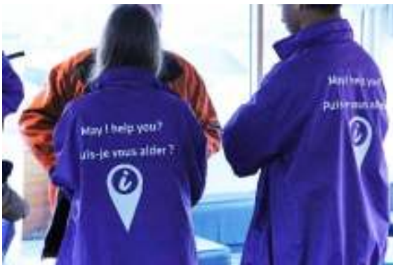
(1020) présence humaine guide Privilégier le contact humain, ici volontaires du tourisme en Île-de-France.