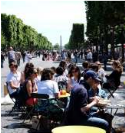
(1014) Pique nique sur l'espace urbain Dans la capitale, une autorisation spéciale est à demander pour les pique-niques de plus de 30 personnes