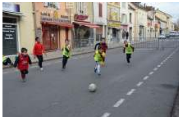
(927) Rue dédiée au sport, aux jeux Fermeture de voirie pour apprentissage du vélo, ou pour du foot de rue pour les enfants