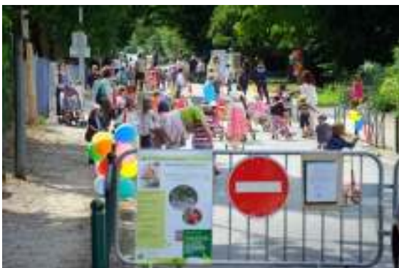
(927) Rue dédiée au sport, aux jeux Trouver d'autres usages à la rue, ici fermeture temporaire à la circulation dans le cadre d'une opération Rue aux enfants.