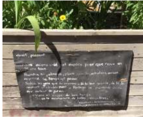
(1015) Potager à partager Des habitants plantent des herbes et légumes à partager comme ici à Tours.