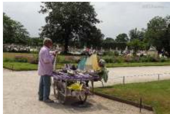
(1021) Présence humaine, vendeu.r.se Vendeur ambulant sur l'espace public, des services et une présence humaine.