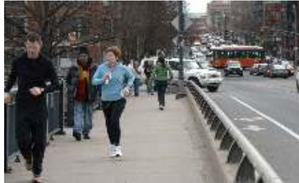
(925) Pratique autonome Les joggings en ville peuvent être facilités par des objets fonctionnels (toilettes, fontaines) ou de la signalétique, notamment pour le sight jogging qui permet de découvrir les villes à petites foulées.