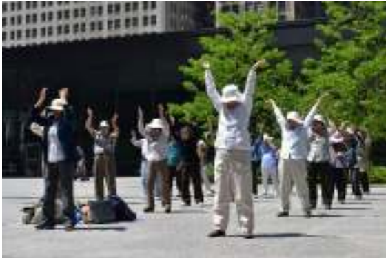
(925) Pratique autonome Certaines activités sportives descendent dans la rue.