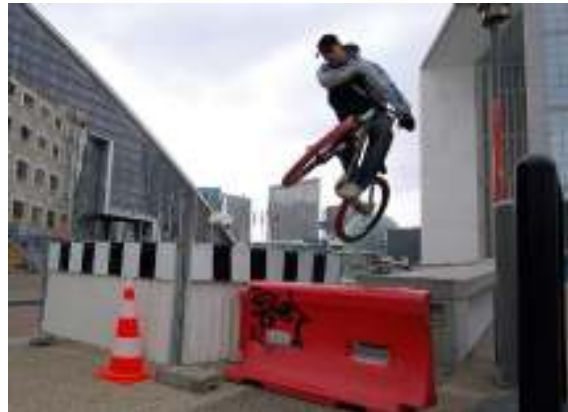
(926) Pratique sur espace non aménagé BMX sur espace urbain, ici à Puteaux, dans le quartier de Paris La Défense.