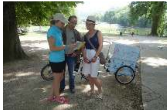
(1020) Présence humaine, guide Les offices de tourisme mobile se multiplient. Et assurent une présence humaine directement sur le site touristique.